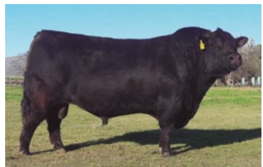
Pronto. Su padre.