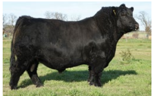
Impacto. Su padre.