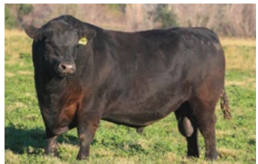
Culminante. Su padre.